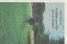
Andarás perdido por el mundo

Esquivias (Burgos, 1972) encuentra en la memoria un viaje sin fin por paisajes donde nunca habital el olvido: "Qué grandes exploraciones se han hecho con el dedo de un niño sobre el dibujo de un río africano y cuántas vocaciones literarias debemos a los cartógrafos! Uno de mis poemas favoritos es Estam-