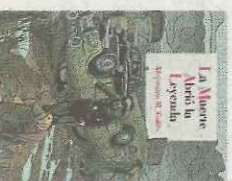
La muerte abrió la leyenda