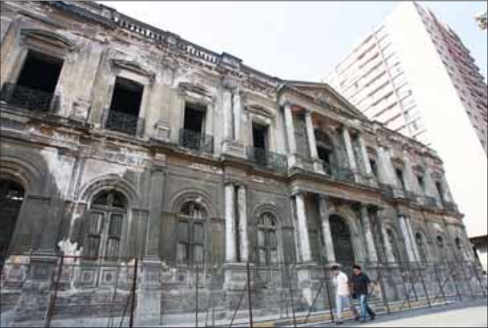
El palacio fue construido en 1872 por el arquitecto francés Lucien Hénault