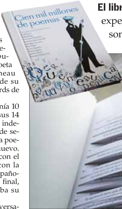
Cada tira tiene un verso, y una hoja recortable al final del libro permite separar un verso de cada poema para armar uno nuevo.