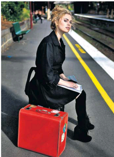
La soledad es uno de los grandes temas de Nedreaas.

Nedreaas escribe sin miedo, mete el cuchillo en la realidad y corta. La prosa, precisa y poderosa, es demoledora, y la autora mira sin temor a la verdad y escribe con coraje. Hay un capítulo al final verdaderamente estremecedor en el que narra un aborto autoprovocado que debería ser de lectura obligada para todos esos antiabortistas que creen que las mujeres abortan porque les va la marcha. Sí, la autora no escatima la realidad del dolor de una vida frustrada como buena escritora nórdica, pero qué admirable distancia literaria con esa mala literatura sensacionalista que nos llega del frío últimamente. •