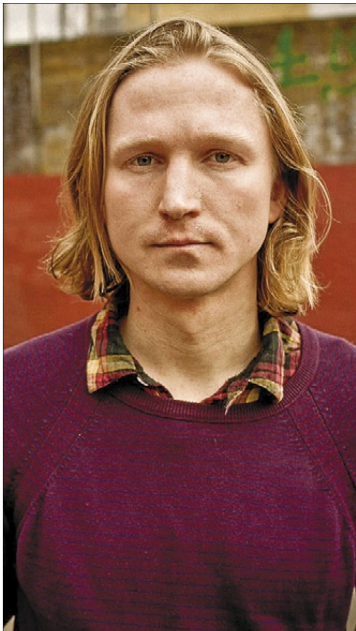
►► El escritor galés Joe Dunthorne.