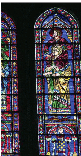
LA LUZ APOSTÓLICA Las vidrieras de la catedral de Chartres están plagadas de simbología (en la imagen, los cuatro apóstoles) y son una de las cumbres del sistema de iluminación arquitectónica del gótico

Como los arquitectos de las catedrales góticas, que incrementaron sus proporciones hasta el límite de la resistencia del material, aligerando el peso y distribuyendo la carga de modo que todo trabajara para su función y conseguir así a la vez unidad y belleza, Adams habla del gótico, de las cruzadas, de la poesía de los trovadores y el amor cortés o de Santo Tomás de Aquino, y construye con todo ello una gran obra en torno al hombre y sus aspiraciones. «A veces uno pierde la compostura razonando sobre lo que solo se puede sentir», dice Henry Adams en algún momento de este libro indispensable y hermoso que nunca pierde el equilibrio entre razón y sentimiento.