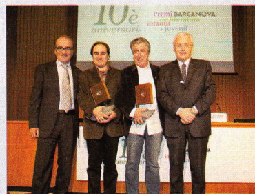
Eduardo Cerredá, Gisbert, Sierra i Fabra y Mascarell.