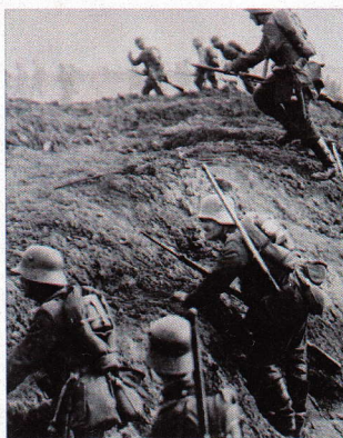
La Gran Guerra en clave espistolar.

Llega a España Vidas rotas (Alianza), de Bénédicte des Mazery , una novela con mucho de realidad que ha dado que hablar en Francia. La autora accedió a las cartas que el departamento de censura del servicio postal del ejército francés impidió que llegaran a su destino durante la Primera Guerra Mundial. Con ese material (en el libro muestra algunas de estas impactantes misivas) nos cuenta el tema desde el punto de vista del soldado encargado de censurar esos mensajes, no tanto por lo que pudieran tener de reveladores de secretos militares como por ser causa de desmoralización entre la población al recibir las noticias de sus familiares desde un frente que se había convertido en un infierno.