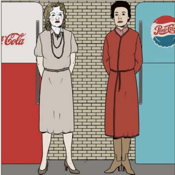
Las actrices Bette Davis y Joan Crawford.

► Una de las leyendas oscuras que rodean El mago de Oz relata que, en una escena situada poco después de que Dorothy (Judy Garland) y el Espantapájaros conozcan al Hombre de Hojalata, puede verse al fondo un hombre colgado de un árbol. La leyenda ganó cuerpo cuando, llegada la era del vídeo casero, los espectadores tuvieron la posibilidad de congelar la imagen en sus pequeños televisores. En efecto, había algo que colgaba de un árbol y ese algo tenía la forma inequívoca de un hombrecillo. La explicación estaba clara. Se trataba de uno de los enanos que encarnaban a los Munchkins, quien se habría ahorcado víctima de un despecho amoroso o, aquí las interpretaciones divergen, tras haber sido despedido del rodaje. Dado que el presupuesto de la cinta ya se había salido de madre, los productores decidieron no volver a rodar la escena y el muerto se quedó ahí para los restos.