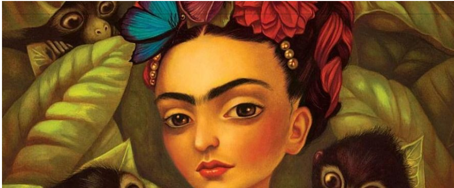
Detall d'una il·lustració de Benjamin Lacombe per a l'àlbum 'Frida' (Edelvives)