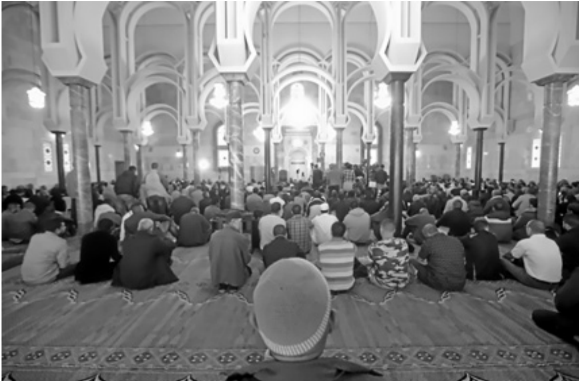
Fieles musulmanes rezan en la mezquita de la M-30 de Madrid.