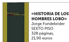
«HISTORIA DE LOS HOMBRES LOBO» Jorge Fondebrider SEXTO PISO 328 páginas, 21,90 euros