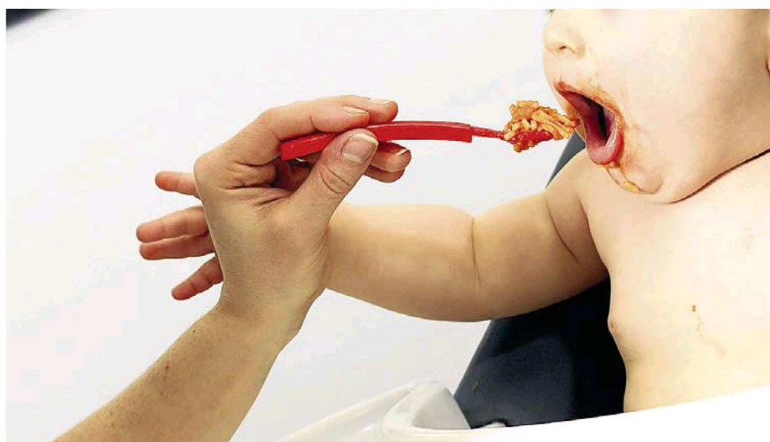
Demasiado a menudo, el debate de la conciliación es presentado como un asunto que deben resolver las mujeres.

➔ mayor o menor medida, relacionarnos con los demás. «Vivimos de espaldas a nuestra propia fragilidad y a las estructuras de cuidados que la palian –asegura–, cuando la realidad es que somos animales extremadamente vulnerables y dependientes desde el nacimiento y que necesitamos un entorno de cooperación y un montón de compromisos que sustentan la vida y que se deben visibilizar y poner en valor».