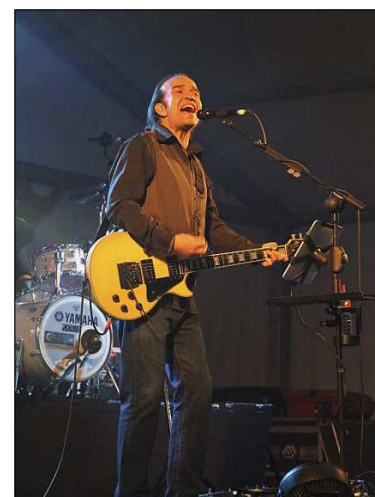
El líder de Los Secretos.

Tres retornos al escenario para agradecer el entusiasmo de las cientos de personas que abarrotaron la Carpa de Carnaval ilustran el incontestable éxito del concierto que el viernes brindaron Los Secretos en Laredo. El evento aglutinó en un mismo espacio a entusiastas de varias generaciones entre las que las letras y estribillos de esta banda siempre han circulado con la devoción con la que se guardan las mejores confidencias. El grupo, uno de los míticos de la escena musical española desde hace más de tres décadas, se vació en un repertorio en el que dieron cabida a temas de su último trabajo, Mundo Raro , pero donde el timón lo llevaron esas canciones convertidas en auténticos himnos para un público que las coreó «en un pueblo con mar, una noche, durante un concierto». El solar de la trasera de los antiguos Juzgados se transformó en una peculiar Calle del Olvido en la que cada cual se reencontró con un océano de recuerdos activados a golpe de acordes.