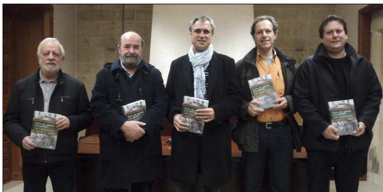
Autores y representantes políticos durante la presentación.