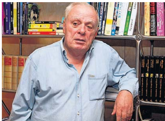
El escritor portugués António Lobo Antunes.

solución. El mejor narrador portugués de los últimos tiempos mantiene la teoría de que por escribir se ha quedado engan-