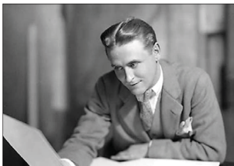
El escritor Francis Scott Fitzgerald.