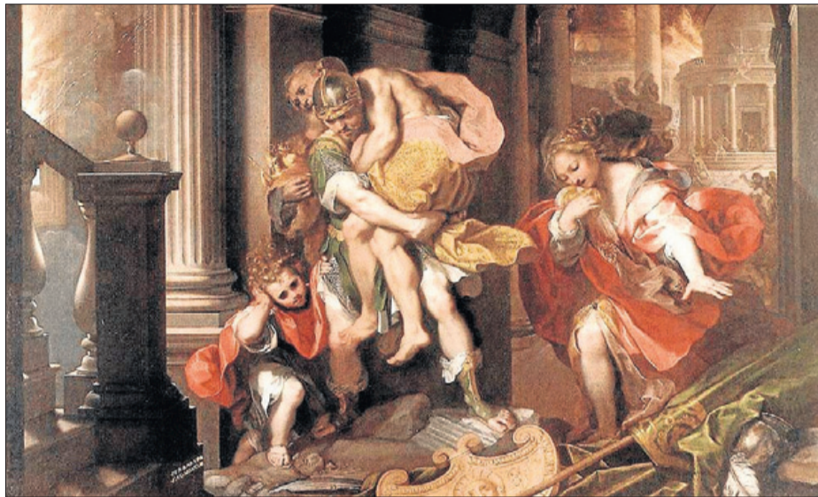
Eneas huyendo de Troya con su padre Anquises en brazos, obra de Federico Barocci. L.O.

► Seix Barral publica en edición de bolsillo una de las obras más conocidas del escritor neoyorquino. Empieza Ciudad de cristal , con un escritor de novela policiaca que, por azar, se ve actuando como un detective por las calles de la ciudad de los rascacielos mientras se cuestiona quién es en realidad. En Fantasmas , se conforma un laberinto de búsquedas que Azul, el detective, deberá desentrañar. En La habitación cerrada , el protagonista recibe el encargo de buscar a un amigo de la infancia desaparecido.