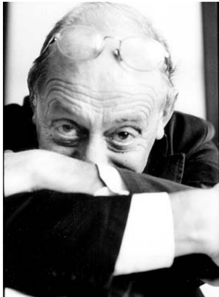
El escritor italiano, nacionalizado portugués, Antonio Tabucchi.

No se trata de incendiar, sino de alumbrar. Claro que sí, querido Tabucchi.