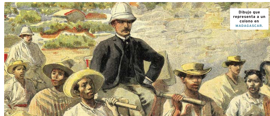
Dibujo que representa a un colono en MADAGASCAR.