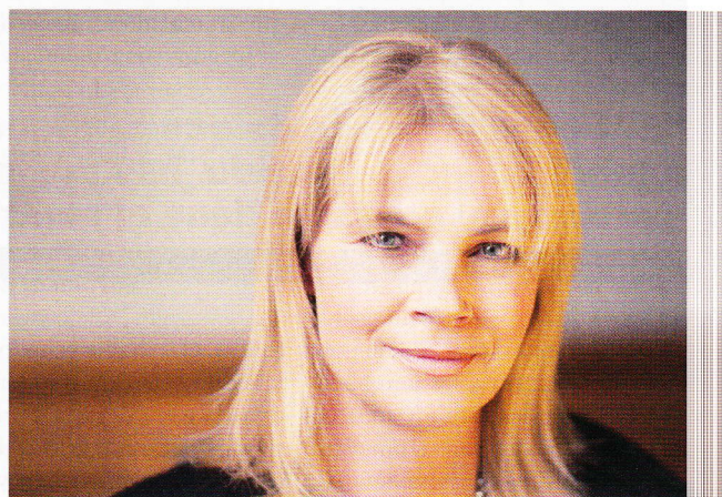
Nele Neuhaus, autoedición y éxito marcados por el crimen.

En el año 2000, Cornelia “Nele” Neuhaus era una residente anónima y treintañera de la cordillera del Taunus que no hacía más que coleccionar negativas para las novelas negras que escribía. Cansada del desprecio de la industria editorial, decidió coger el toro por los cuernos y pagó de su bolsillo una edición de quinientos