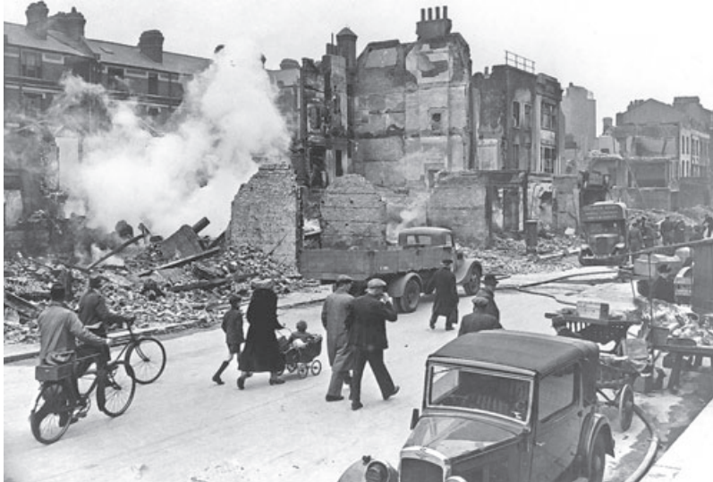
Imagen de una calle de Londres asolada por los bombardeos alemanes en la Segunda Guerra Mundial

Es en este escenario donde sitúa Westwood y donde la romántica profesora Margaret Streggels trata de encontrar sentido a su vida. Quizá, con la lectura del relato sobre esta joven soñadora, resulta más fácil entender por qué se califica a Gibbons como la Jane Austen