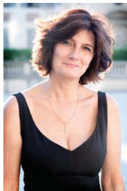
La escritora Sophie Fontanel.

qué pensamiento". Olvidamos en la base de la acción toda posibilidad de sueño, nos convertimos en meros autómatas, también del sentimiento, también del sexo. Sophie decide escuchar al cuerpo: "Ya no soportaba el dejarme hacer. Había dicho si demasiadas veces. No había te-