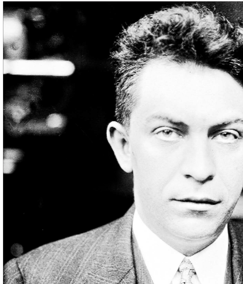
Retrato del periodista sevillano Manuel Chaves Nogales.

Los desplazamientos aéreos de Chaves Nogales le sirven para constatar lo que encontrará al aterrizar: el contraste entre la España reseca y despoblada y la campiña francesa, que ya muestra el secreto de la grandeza de Francia, esa «campiña exuberante», fruto «del esfuerzo de estos millones de aldeanos». El periodista otea el poderío industrial de Alemania, la pobreza de la naciente Checoslovaquia, la enormidad de Rusia («volar por el territorio ruso es como seguir una ruta con el dedo sobre el mapa»), a pesar de su extensión, una nación atrasada en la que se observan cientos de isbas tan