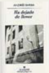
HA DEJADO DE LLOVER Autor: Andrés Barba. Novela. Editorial: Anagrama. Páginas: 205. Precio: 16,90 euros