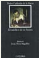
EL MÉDICO DE SU HONRA Autor: Pedro Calderón de la Barca. Teatro. Editorial: Cátedra. Páginas: 412. Precio: 10,80 euros.