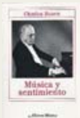
MÚSICA Y SENTIMIENTO Autor: Charles Rosen. Música. Editorial: Alianza Editorial. Páginas: 140. Precio: 16 euros.