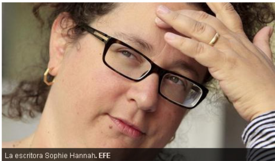
La escritora Sophie Hannah.

Mujeres desquiciadas, incomprensidas, cuestionadas, sumidas en una eterna crisis de ansiedad: así son las heroínas de la escritora británica Sophie Hannah , cuya nueva novela llega ahora a España con