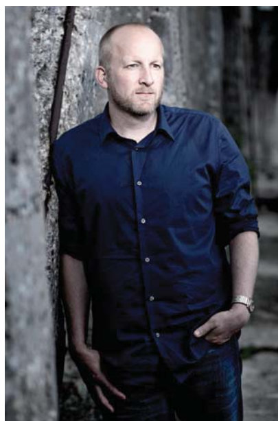
El escritor danés Lars Husum.

su protagonista inadaptado. "No quiere pegarme porque en cada golpe me arrancaría un pedazo de culpa y debo conservarla íntegra". Hablemos de tremendis-