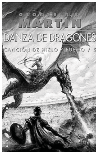
'Danza de dragones', de George R.R. Martin