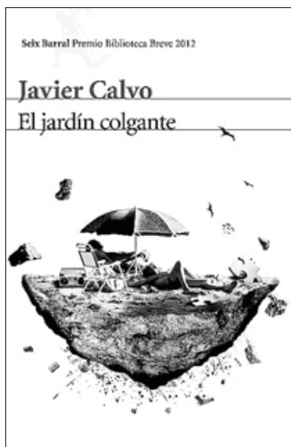
'El jardín colgante', de Javier Calvo