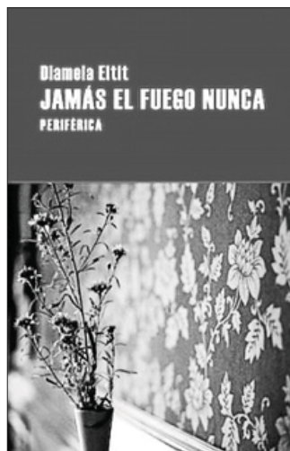
'Jamás el fuego nunca', de Diamela Eltit

(Seix Barral), y también, parcialmente, como de paso, Diamela Eltit en 'Jamás el fuego nunca' (Periférica). Historias críticas de la vida social y política de los últimos cuarenta años, poniendo el acento en lo que se hizo y en lo que no se hizo durante la tan alabada Transición democrática española.