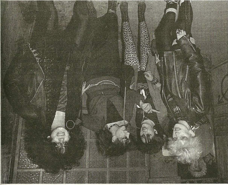
Movida madrileña, Madrid, 1985