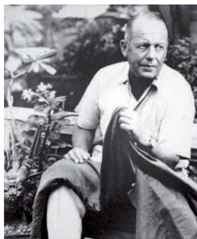
El escritor norteamericano Jim Thompson.

ficarle de Dostoievski de todo a cien, cuyas historias reflejan "con toda fidelidad una mentalidad que nos rodea y que es tan americana como el próximo asesinato en masa". Junto con la