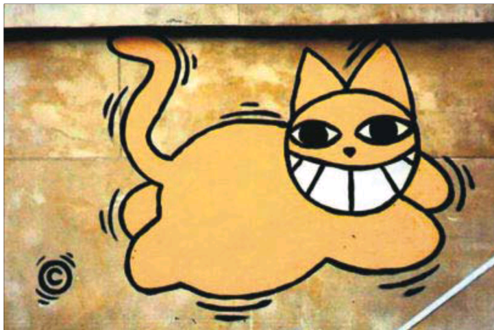
Uno de los grafitis de M. Chat cuya pista sigue la cámara de Chris Marker en Gatos encaramados .

Cada vez más son los grupos que, conscientes del poder de la página, presentan sus trabajos en YouTube antes que en cualquier otro medio. El pasado lunes el grupo británico Muse adelantó su nuevo sencillo a través de la página y ya registra más de dos millones y medio de reproducciones en su canal. Datos como este invitan a plantearse una última pregunta... ¿se escucha más música gracias a Internet? Los consultados para la confección de este reportaje responden con un sí unánime, aunque con matices. Los que van de Joséle Santiago ("se consume más, pero en su mayoría no es para escuchar, sino para hacer más llevaderas cosas como conducir o hacer la compra") a Carlos Jean, dj y productor: "Antes escuchabas una canción mientras te tomabas una copa y no la volvías a escuchar hasta el viernes siguiente. Ahora un chico de 18 años con interés tiene a su disposición muchos más medios".