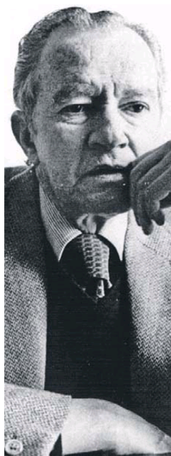
Retrato de Juan Rulfo

costumbre que se aplica sólo a las autoras). La clave, como era de esperar, se encuentra en la infancia del escritor. Rulfo vino al mundo en una familia acomodada, pero en un entorno lleno de violencia: bandolerismo, guerra cristera... Cuan-