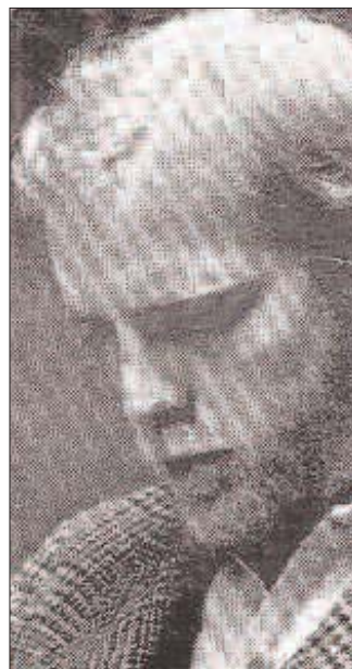
Breece D'J Pancake.

Sus protagonistas son, casi todos, personajes duros, con olor a alcohol, sudor y barro; son trabajadores en su significado más puro y tradicional, camioneros, mineros, quitanieves. Son hombres sin escrúpulos que lo mismo le arrancan la placenta a una zorra y se comen su hígado, que despellejan a una ardilla y se chupan la sangre de los dedos. Personas cansadas, agarradas con conformismo agónico a la tierra que tienen bajo sus pies.