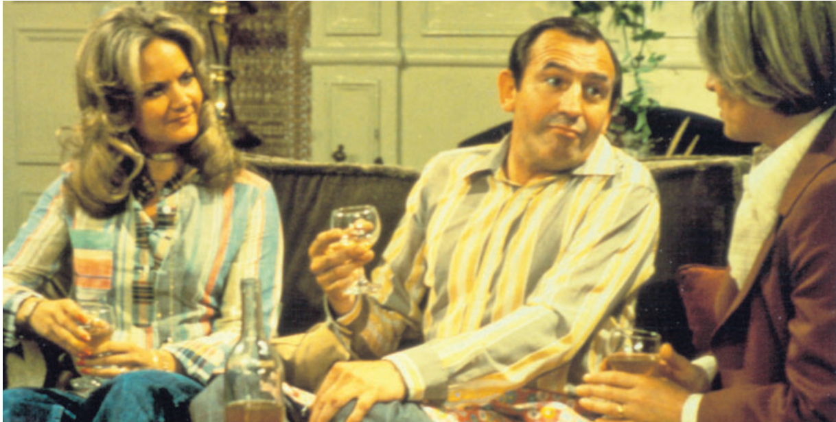
El actor Leonard Rossiter —en el centro del fotograma— interpretó el papel de Reginald Perrin en la adaptación de la obra de David Nobbs que produjo la BBC