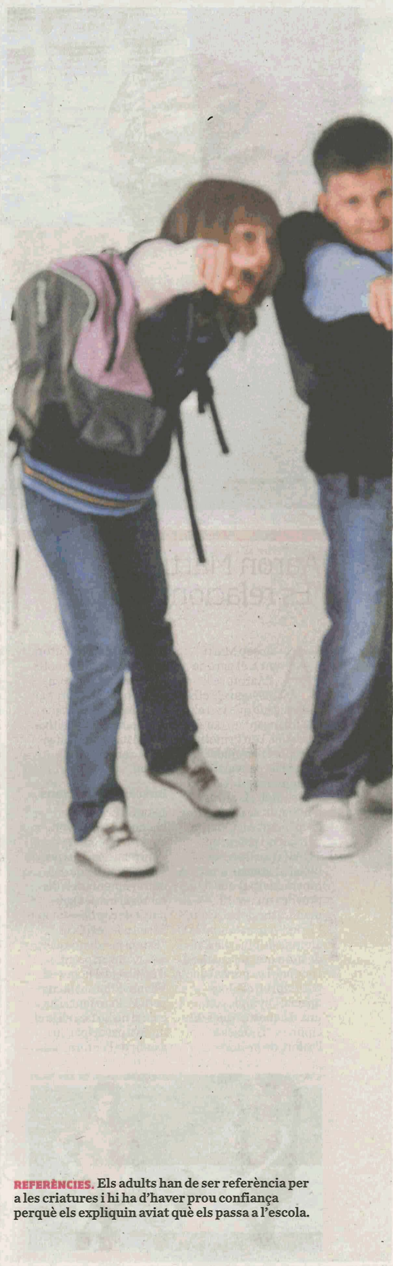
REFERÈNCIES. Els adults han de ser referència per a les criatures i hi ha d'haver prou confiança perquè els expliquin aviat què els passa a l'escola.