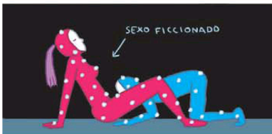
LA EXPLORACIÓN MOTION CAPTURE DE "HOLY MOTORS"

Paradójicamente lo mismo que hace que estas escenas sean reforzadas y perversas es lo que las libra de ser clasificadas X. Pero, ¿se podría ir más lejos?