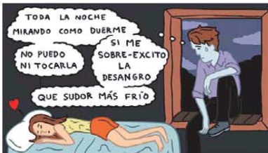
"CREPÚSCULO": UNA POST-PORNOGRAFÍA PARA ADOLESCENTES

Paradójicamente lo mismo que hace que estas escenas sean reforzadas y perversas es lo que las libra de ser clasificadas X. Pero, ¿se podría ir más lejos?