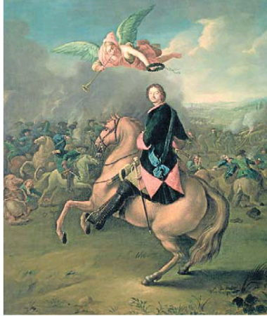
Retrat de Pere el Gran a la batalla de Poltava