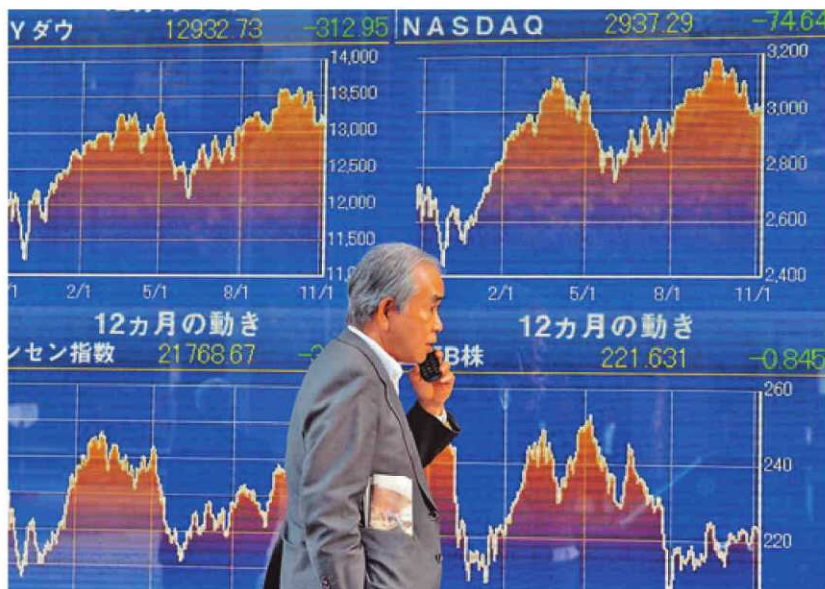
En la Nueva Edad Media, el feudo no está en la tierra, sino en la deuda, según la teoría de la posteconomía

Baños divide su libro en tres partes diferenciadas. En la primera explica por qué la economía ya no es útil para explicar la situación y por qué ha sido reemplazada por la posteconomía, la doctrina o religión en la que «los economistas y su brazo armado (financieros y