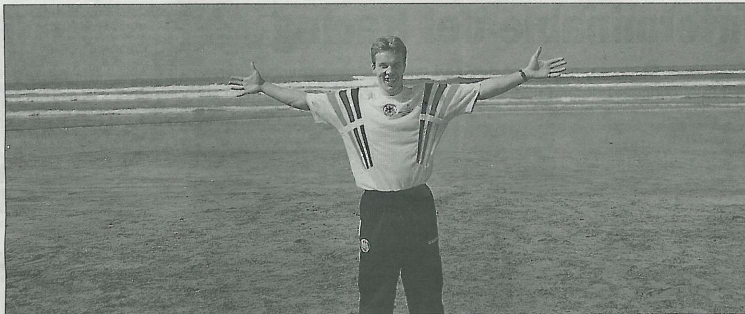
Robert Enke, con la camiseta de la selección alemana, en una de las fotografías de la biografía del portero que se suicidó hace tres años.