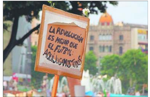
Necesidad de crítica, de un sentimiento común que no sea un juego.

Analizando en sus tres partes la globalización neoliberal, la crítica de la esencia/existencia capitalistas y la herencia del comunismo, la abundancia de preguntas y respuestas que plantea ‘Pensar desde la izquierda’ impide cualquier resumen y una lectura superficial. El lector no encontrará aquí un manual de uso rápido, tal y como nos tiene acostumbrados precisamen-