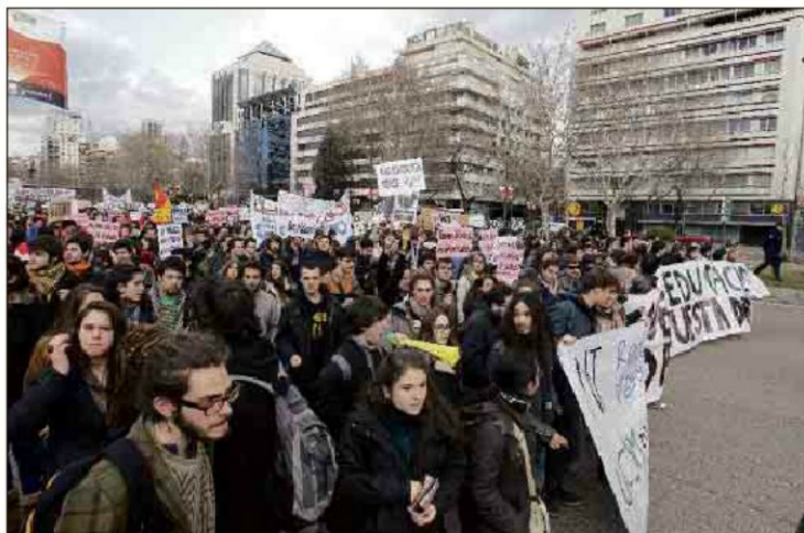
Cabeza de la manifestación de estudiantes de las universidades públicas en Madrid.

«éxito» la huelga en las universidades madrileñas, donde por la mañana los denominados «pasacampus» animaron a los compañeros de los huelguistas a sumarse al paro estudiantil, al igual que en otras ciudades.