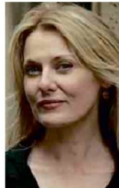
La escritora Anna Funder.

A través de estas páginas Funder nos ofrece una visión exacta