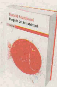
DESPRÉS DEL TERRATRÈMOL Haruki Murakami Empúries

Irving ens ofereix la història d'un escriptor al llarg de mig segle, que ha d'afrontar tots els equívocs sobre la seva condició sexual. La novel·la recrea una història tempestuosa, divertida i commovedora sobre els enamoraments inadequats, els amors insatisfets i una acceptació decidida i valenta de les nostres diferències sexuals. Amb una trama complexa, però nítida, Irving ens ofereix una galeria de personatges que s'interroguen sobre la veritat i la passió.