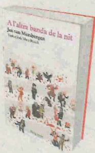
A L'ALTRA BANDA DE LA NIT Jan van Mersbergen Raig Verd

Les falses memòries del capità anglès George Carleton durant la guerra de Successió serveixen Defoe per escriure una novel·la d'aventures i intrigues ambientada en la Catalunya de 1713, abans del tractat d'Utrecht. L'autor de Robinson Crusoe s'esplaia en observacions sobre els costums locals, narra l'heroicitat dels catalans i de les forces aliades contra l'exèrcit borbònic, descriu magníficament la presa del castell de Montjuïc, i es deixa impressionar per l'espectacle geogràfic i espiritual del conjunt benedictí de Montserrat. Un clàssic.