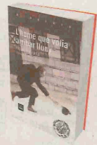
L'HOME QUE VOLIA ARRIBAR LLUNY Hans Fallada Edicions de 1984

La desaparició de la seva filla porta en K. a una incessant cerca per descobrir-ne el parador durant la dictadura militar brasilera. La seva investigació el portarà a afrontar els sentiments de culpa i a descobrir la identitat militant de la seva filla. Aquesta és la història d'una de les milers de desaparicions ocorregudes a Sud-amèrica durant els seixanta i setanta, conseqüència de la política nord-americana durant la Guerra Freda, en la lluita contra el comunisme.