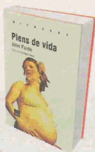
PLENS DE VIDA John Fante Edicions de 1984