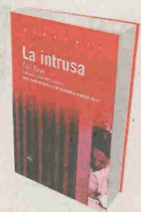
LA INTRUSA Éric Faye Edicions de 1984

Seguint la política d'autor que Edicions 1984 ha fet amb Hans Fallada, ens arriba una nova novel·la. Un noi orfe de setze anys arriba a Berlín acaronant el somni de conquerir la ciutat. Càndid i orgullós, l'irreductible afany de prosperar el portarà a fer de manobre, a tragar maletes i, fins i tot, a transportar armes clandestinament, però, sobretot, el convertirà en un testimoni i en un observador atent de la societat berlinesa.