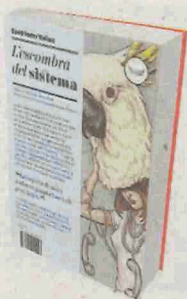
L'ESCOMBRA DEL SISTEMA David Foster Wallace Periscopi

Per fi el benestar s'albira en la vida de John Fante. Ha deixat enrere els temps indòmits, i a Hollywood tothom parla de les seves novel·les. Però Fante també s'ha convertit en un home atònit: navega entre el temor i l'eufòria per l'embaràs de la seva dona, la Joyce. A més, diferents afers quotidians se li giren en contra. Histèria en plena època de l' American way of life .