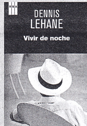
DENNIS LEHANE «VIVIR DE NOCHE» RBA

Un matrimonio que hace aguas, una mujer que desaparece y un marido excesivamente firme son los ingredientes con los Flynn ha creado uno de los thrillers más originales, adictivos y afilados del año. Explosivo.