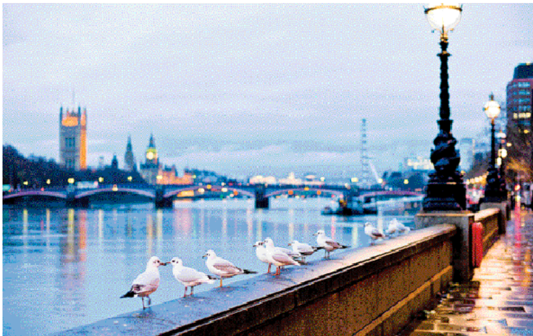
En los últimos años escritores ingleses han publicado extraordinarias novelas sobre el 'estado de la nación'

Revisando su ensayo fundacional, da la sensación de que De Forest toma su idea de la Gran Novela Americana a partir de una especie de subgénero narrativo inglés: las 'state of the nation novels'. Eso es al menos lo que hacen pensar los autores que señala en su ensayo como modelos para una nueva ficción capaz de "dibujar las costumbres y emociones de la América real". Entre sus contemporáneos, De Forest