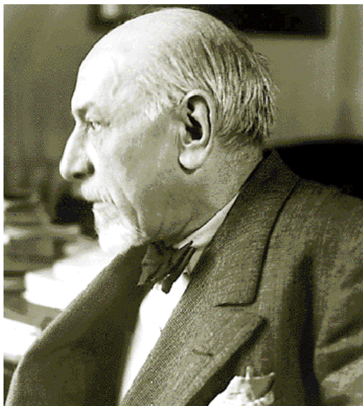
Los cuentos de Pirandello ofrecen una visión amarga y paradójica de la vida