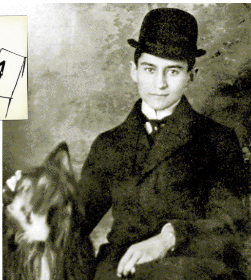
La obra literaria de Kafka refleja la angustia existencial del hombre moderno