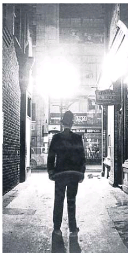
Policía londinense de 1900

Un joven de buena familia y no tan buena reputación huye de Londres. Cinco años después, en 1894, regresa y se encuentra con una ciudad "mucho más seria y más triste". Y todavía falta un año para el juicio y condena de Oscar Wilde, de quien el testarudo y sagaz Eddie Knox no tiene muy buena opinión. En cambio, el autor de este libro deja caer unas cuantas genialidades, propias de ese escritor que brillaba en los salones y que, otra vez retrocediendo cinco años atrás, se sentaba una inolvidable