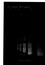
Amador de los Ríos. Los judíos de España. Estudios históricos, políticos y literarios. Urgoiti Editores, Pamplona, 2013, CLVIII + 482 págs. 40 €

Como reza el subtítulo de la obra, no se trata de una mera his-