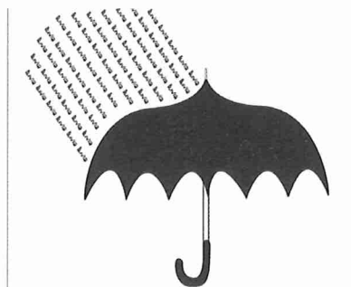
Uno de los pictogramas de Joan Brossa.

Joan Brossa (1919-1998) es uno de los grandes poetas catalanes del siglo pasado. Integrante del mítico Dau al set, artista visual, pintor... sus aristas creativas fueron múltiples, variadas y todas ellas estimulantes. También la de prosista, tal vez su faceta menos conocida. Prosa completa i textos esparços (RBA), con edición a cargo de Glòria Bordons, es un apasionante y extenso -766 páginas- volumen que da fe de dicha faceta. Se trata de un acopio de textos ya publicados en libros como Vivàrium o Anàlfil , pero también de otros inéditos o que se habían publicado en volúmenes sueltos en forma de prólogos, presentaciones de espectáculos y exposiciones o artículos de