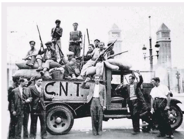
Miembros de la CNT, en la plaza de España de Barcelona al inicio de la Guerra Civil.

NARRATIVA. TAN SOLO UNOS MESES después de la aparición de El continente , primer volumen de la colosal trilogía El tiempo y el viento del brasileño Erico Verissimo (1905-1975), nos entrega su segundo volumen, El retrato (publicado originalmente en 1951), tras una cubierta que reproduce una bellísima obra de la artista carioca Tarsila de Amaral. Si en El continente asistíamos a la fundación de Brasil a partir de una historia localizada en el sur del país, en la región de Rio Grande do Sul, en El retrato la historia continúa protagonizada por uno de los personajes del primer volumen, convertido ahora en eslabón hacia un tiempo nuevo, los primeros años del siglo XX, con una nueva realidad social y política. A través de las aventuras de este