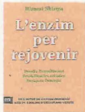
L'enzim per rejuvenir HIROMI SHINYA Ara Llibres

Amb L'enzim prodigiós , el doctor Hiromi Shinya s'ha convertit en un bestseller internacional que ja supera els dos milions d'exemplars venuts. Cap de la unitat endoscòpica quirúrgica del centre mèdic Beth Israel a Nova York, Shinya publica ara un nou assaig, en què proposa un pla de rejuveniment personalitzat a partir de la cura dels enzims. Sanejar les cèl·lules per recuperar l'energia és una de les propostes del metge d'origen japonès.