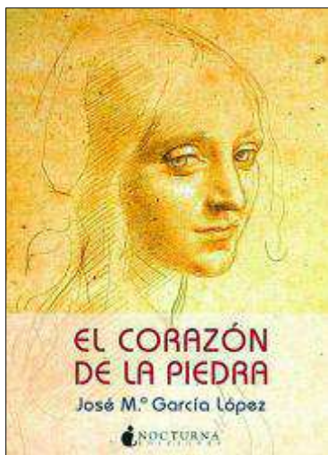
Portada del libro.

sas, estuvo algo de lo mejor que la España de su época pudo dar al mundo en forma de arte y belleza, en contraposición a la barbarie que en forma de guerras y otros tipos de luchas se dieron en el Im-