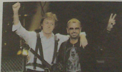
Paul McCartney y Ringo Starr vuelven a compartir escenario.

Aparte de esta confirmación, sin lugar a dudas de incalculable interés para los melómanos en general y los beatlema-